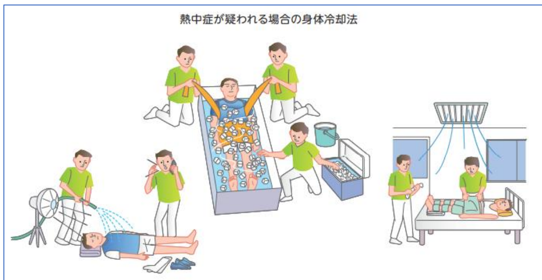
図1：熱射病が疑われる場合の身体冷却法（日本スポーツ協会をもとに作成）

暑熱環境下の実際のスポーツ活動時には、身体内部（アイススラリーや冷えたドリンクの摂取）と外部からの冷却を組み合わせることが望ましいです。チームとして冷却用の氷や水を用意することも大切です。